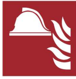
Geräte zur Brandbekämpfung