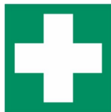
Erste Hilfe Koffer